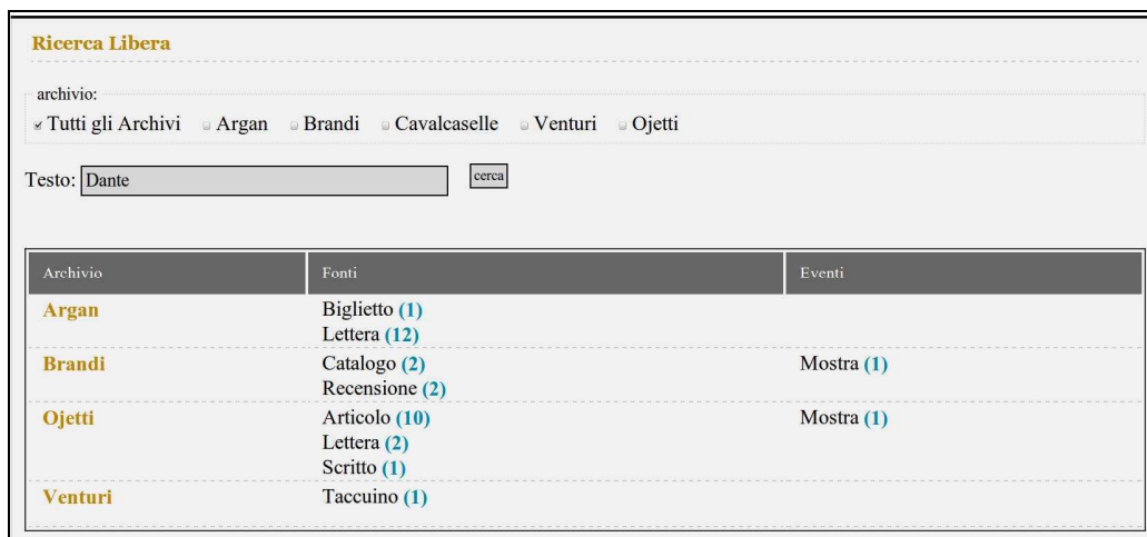
Figura 2. L'interfaccia di ricerca full-text e l'elenco dei risultati.

Il motore di indicizzazione dei dati utilizzato all'interno dell'applicazione web per la ricerca full-text è basato su Lucene 2 . Lucene è una libreria (API) gratuita e open source estremamente flessibile ed adattabile ad ogni esigenza di ricerca. L'interfaccia di ricerca full-text (Fig. 2, in alto) offre la possibilità di scegliere se effettuare la ricerca su tutti o solo alcuni degli archivi documentali (Fonti ed Eventi di Cavalcaselle, Venturi, Ogetti, Argan e Brandi) e presenta una semplice casella di testo nella quale l'utente può inserire uno o più termini.