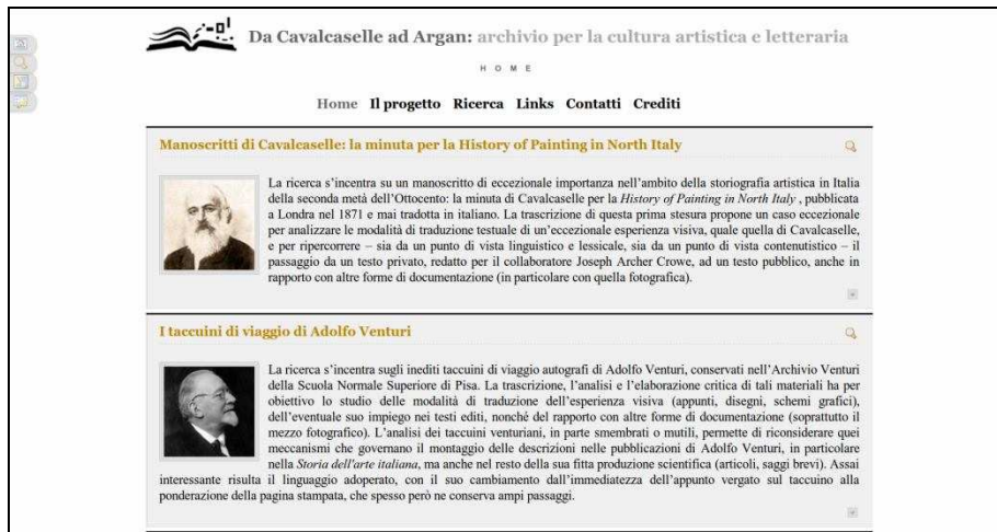
Figura 1. Il frontend dell'applicazione.

Il modulo di ricerca è composto da due componenti: la ricerca full-text e la ricerca avanzata. La ricerca full-text consente all'utente di ricercare quanto desiderato fornendo esclusivamente una chiave di ricerca. Esempi famosi di motori di ricerca full-text sono Google e Yahoo!.